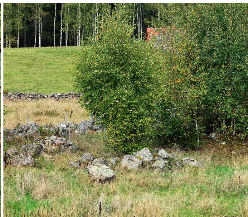
Skillnaden mellan mark som betats och mark som inte betats